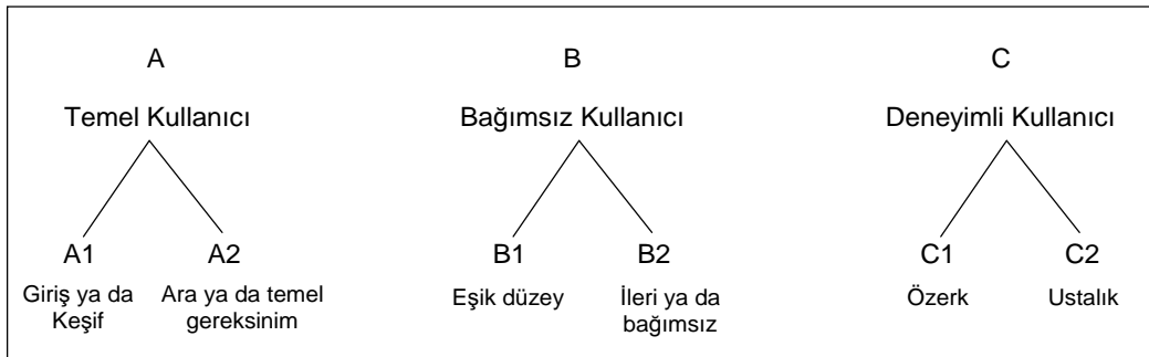
OBM Ölçütlendirilmiş Düzeyler

Yukarıda bahsi geçen iki temel yaklaşıma ek olarak programda, basitten karmaşığa, yakından uzağa, somuttan soyuta olmak üzere dinleme-anlama, konuşma, okuma-anlama ve yazma becerilerine odaklanılmış, öğrenci merkezli olması hedeflenmiş ve Diller İçin Avrupa Ortak Başvuru Metni’nden (OBM) yararlanılmıştır.